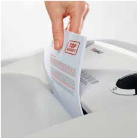
Bis zu 30 % höhere Blattleistung durch die innovative MHP Technology®