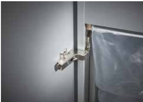
Dahle Aktenvernichter Office 416