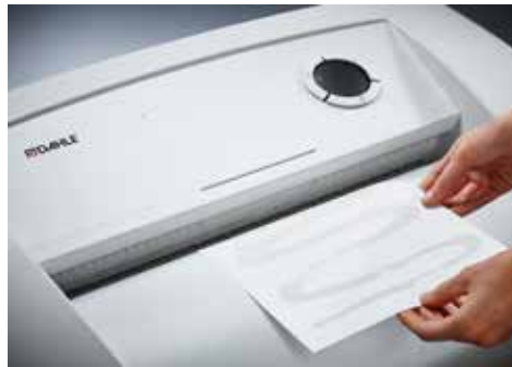
Dahle Aktenvernichter Office 416