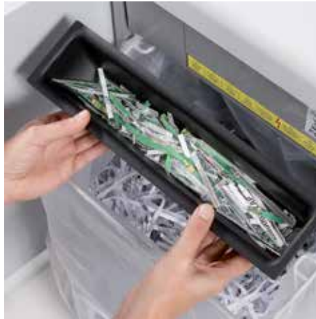
Separate, integrierte Auffangbehälter unterstützen bei der umweltfreundlichen Abfalltrennung von Papier und CDs, DVDs, Scheck- und Kreditkarten