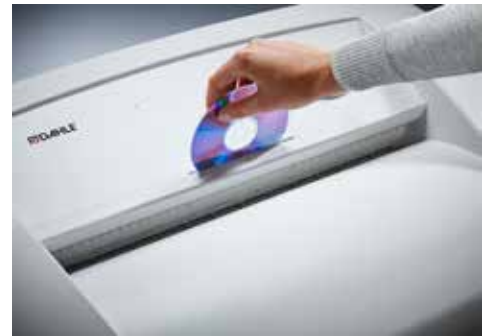
Dahle Aktenvernichter Office 416