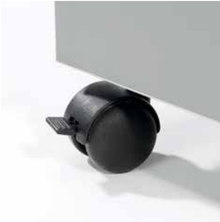
Praktische Lenkrollen für den flexiblen Einsatz