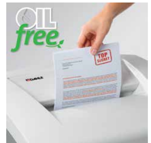
Komfortabel vernichten, völlig ohne zeitraubendes Ölen der Schneidwalzen