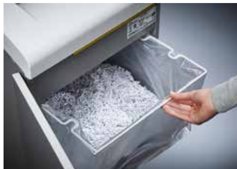
Dahle Aktenvernichter Office 416