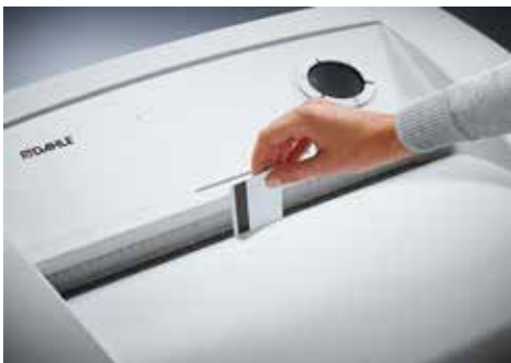
Dahle Aktenvernichter Office 416